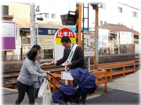
踏切道通行者への啓発活動

踏切道を通行する自動車のドライバー及び歩行者を対象に、交通ルールの遵守、安全意識を高めることを目的とした「踏切事故防止キャンペーン」を近畿地区の行政機関、警察、鉄道事業者及び自動車関係団体等が協力し実施します。