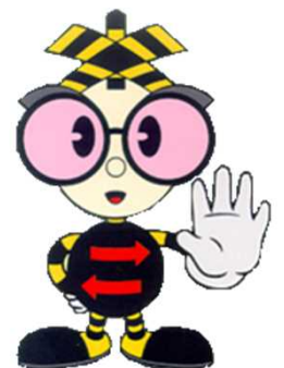
踏切事故防止キャンペーン マスコットキャラクター (愛称:ストッピー)