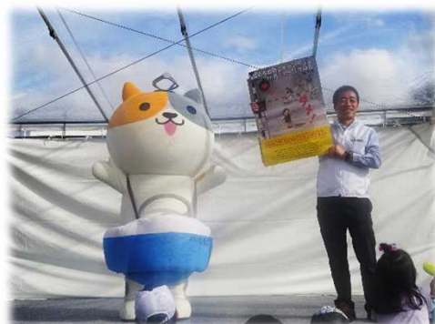
鉄道の日イベントでのPR活動