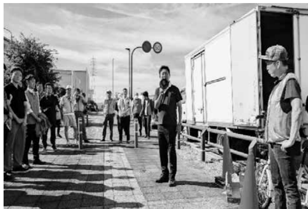
(尼崎市長 松本 眞氏)